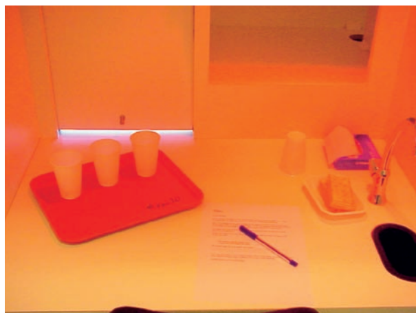
Figuur 1. Unit in een smaakcentrum voor het uitvoeren van sensorisch onderzoek.

Bij een positieve DBPGVP blijft het eliminatieadvies van kracht. Positieve DPFCFC's voor soja en melk worden na ca. 1 jaar herhaald, kippenei na ca. 2 jaar en pinda en noten in de tienerjaren. Bij een negatief